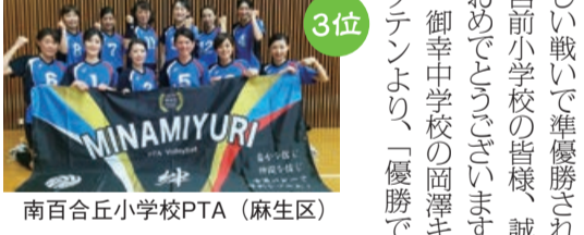
南百合丘小学校PTA (麻生区)