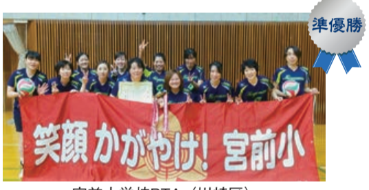
宮前小学校PTA (川崎区)