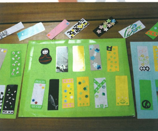
▲作成されたしおりのみほん